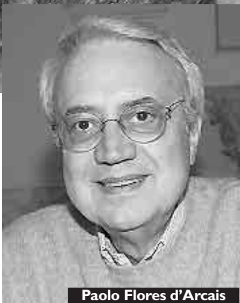
Paolo Flores d'Arcais